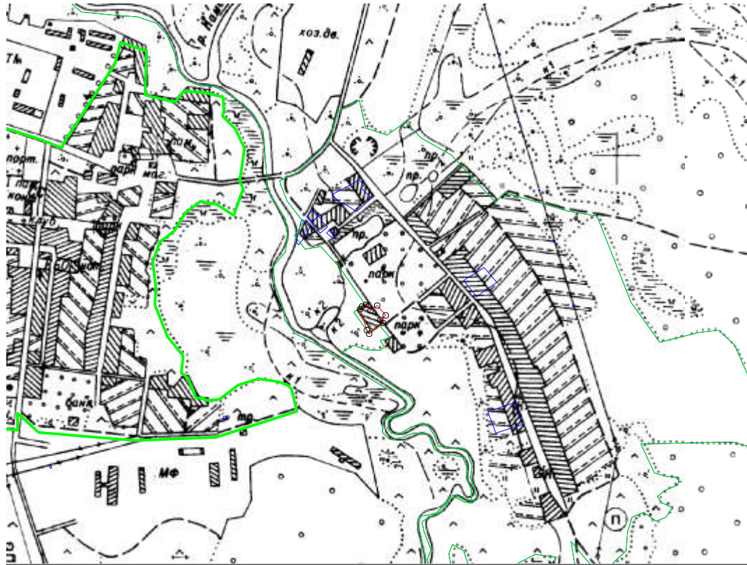
Схема расположения земельного участка в кадастровом квартале 67:14:1590101:

1500 кв.м.- площадь проектируемого земельного участка